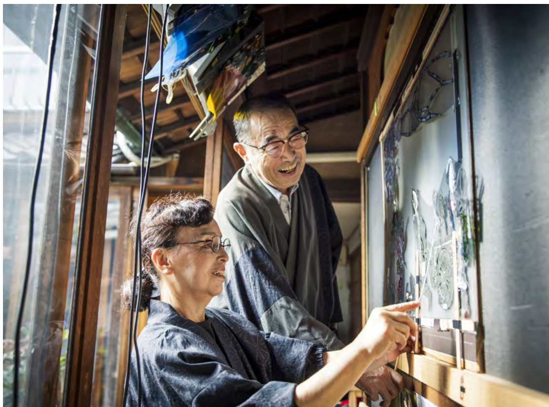
さまざまな人を巻き込みながら、20年で25作のオリジナル歴史影絵劇を作ってきた角田夫妻。