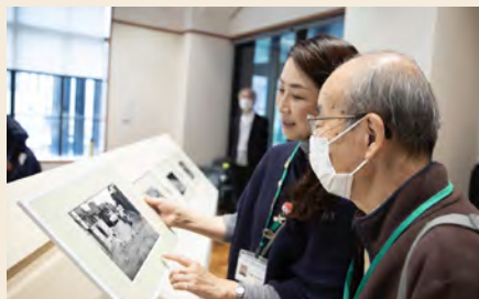
川崎市でのワークショップ「写真の中を旅しよう!」の様子。

アートや文化活動は、そうした自己を超えてつながりを感じる精神の働きを助けてくれます。例えば、歴史的建造物を見て千年前の世界とつながったり、作品を通じて国境という境界線を越えたりすることもあるでしょう。また、アートには正解がないため、二項対立の価値観を超えて物事を捉えることができます。アートや文化活動が健康に資する科学的裏付けや評価への国際的な関心は年々高まり、「文化的処方」は世界的に期待されている分野なのです。