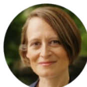
Christelle Creff / クリステル・クレフ フランス文化省 文化遺産・建築総局次長 兼 美術館局長