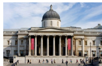
Gabriele Finaldi / ガブリエレ・フィナルディ ナショナル・ギャラリー館長(英・ロンドン)